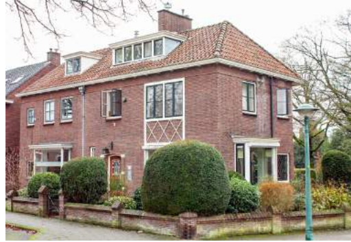
Hoekoplossing Buitenzorgplein Floresstraat