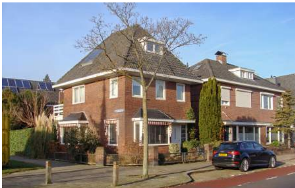
Hoekoplossing Jacob Obrechtstraat-Perikweg