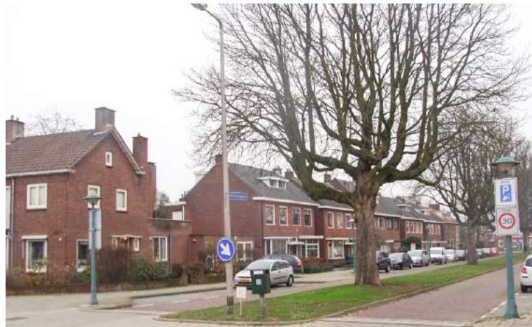
Buitenzorgplein met karakteristieke belanting.