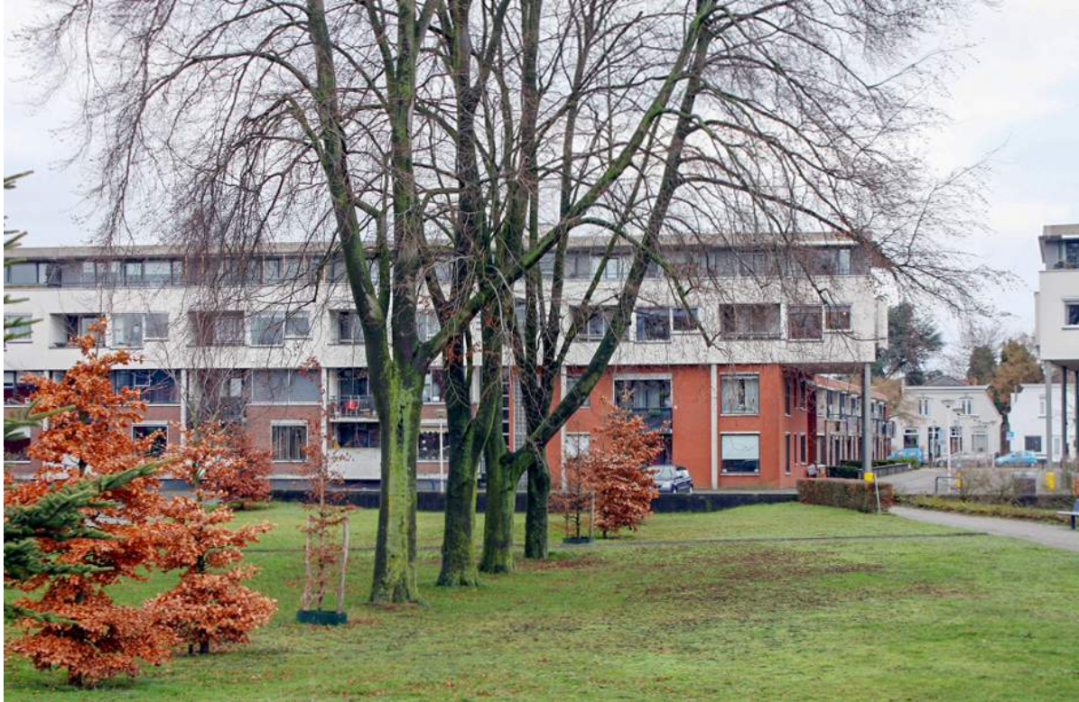
Bebouwing en bomen Perikplein.