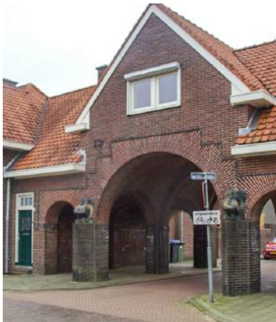
Poortgebouw Buitenzorgplein Bataviastraat