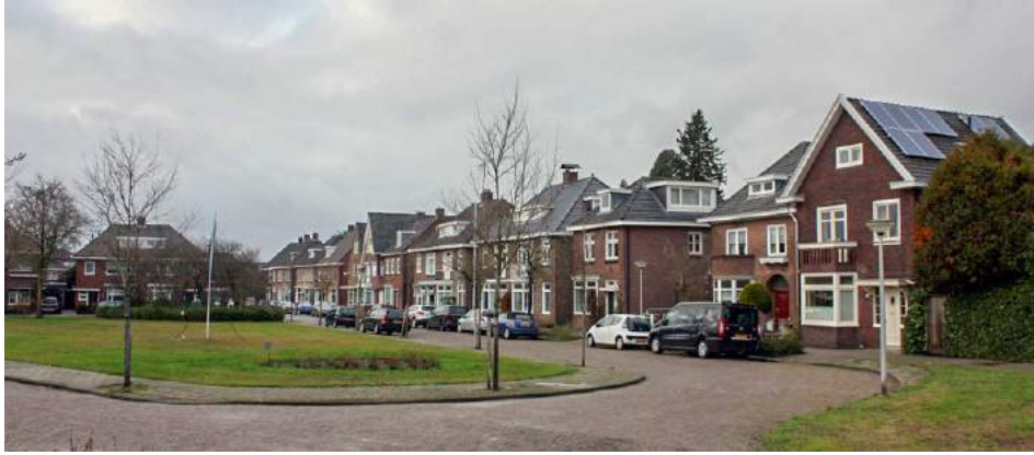
Plantsoen bij Richard Holstraat.