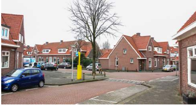
Kruising Semarangstraat Soerabajastraat