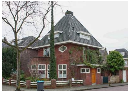
Hoekoplossing Varvikweg- J.P. Sweelickstraat