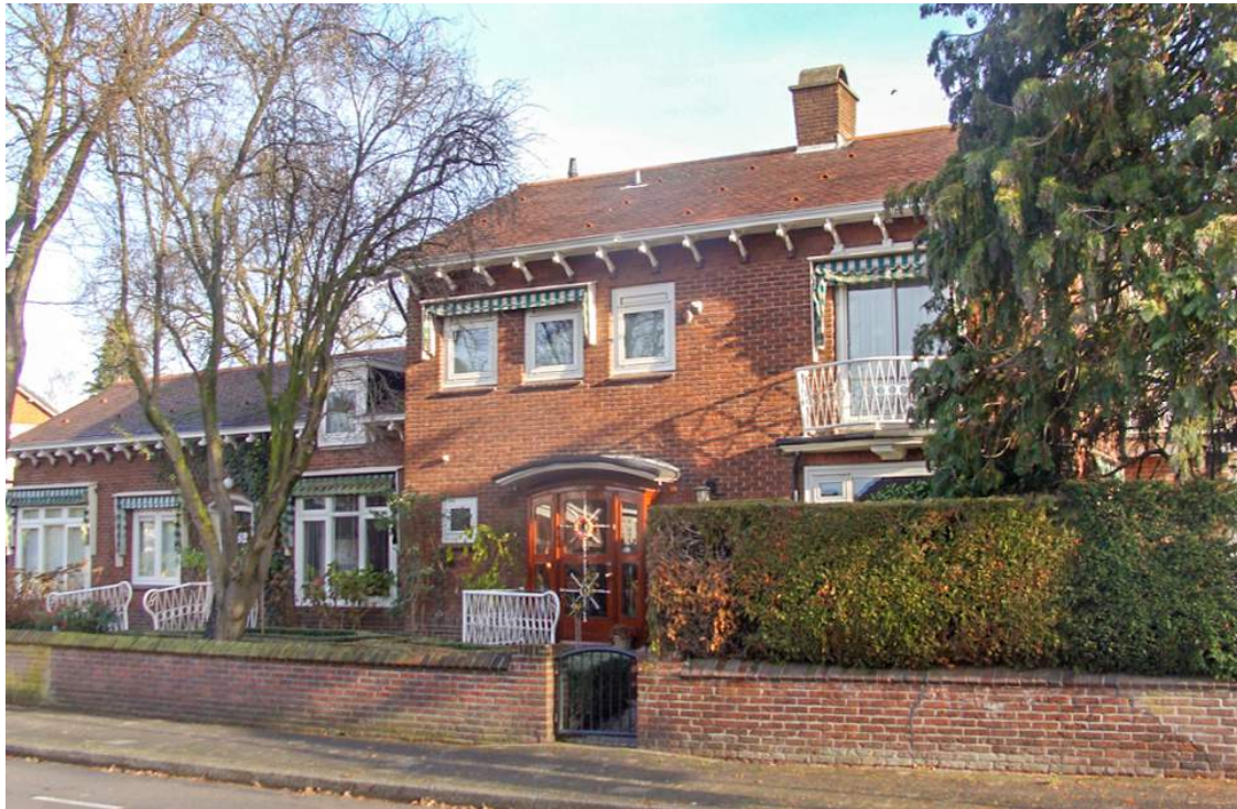
Hoekoplossing Perikweg Hogelandsingel

huidige inventarisatie ten behoeve van het bestemmingsplan Getfert/Perik/Hogeland Noord. Als men voor de architectuur terug wil grijpen op het verleden zijn er dus veel mogelijkheden. Het meest voor de hand ligt echter dan de Wederopbouwperiode als inspiratiebron. Men sluit daarmee dan aan bij de nieuwbouw, die eerder op en rond (voormalig) BATO terrein is ontstaan.