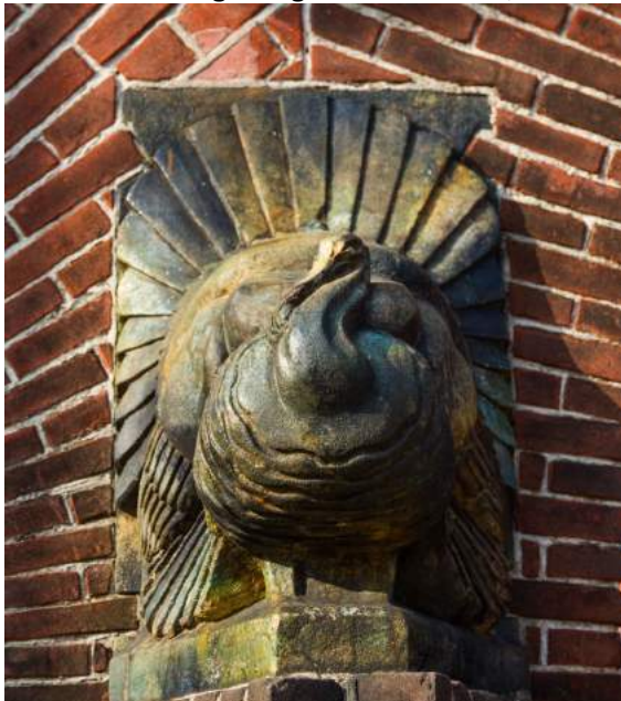
Keramiekbeeld van kalkoen bij Bataviastraat.

Niet alleen aan de bouw van de zogenaamde middenstandswoningen in de omgeving van het BATO terrein is de zorgvuldigheid af te lezen, maar ook de wat men vroeger de arbeiderswoningen noemde